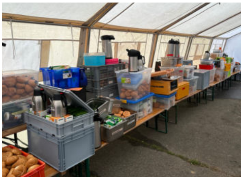
Hier zu sehen ist die begehrte Ware