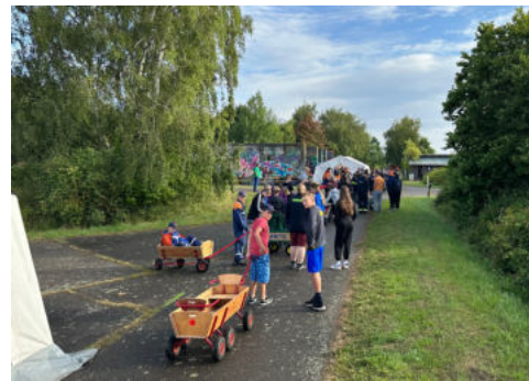
Die lange Schlange vor dem Küchenzelt

Bilder, wie man sie sonst nur von Apple-Stores nach der Veröffentlichung des iPhones kennt. Bereits einige Minuten vor Beginn der Essensausgabe zum Frühstück gab es eine sehr lange Schlange. Augenzeugen berichten von teils sehr ausgehungerten und ungeduldigen Personen, die seit gestern Abend nichts gegessen hatten.