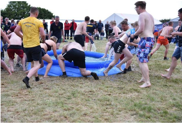
Der Betreuer Cup (ohne Worte)